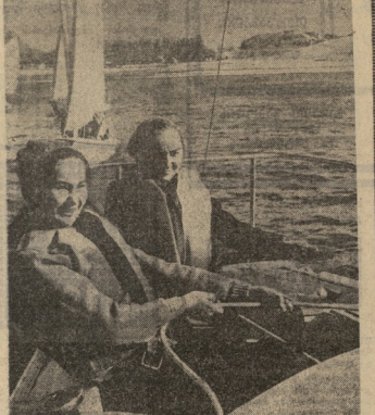
Երգիչ Ե. Բ. Մանուկյանը: Երկրի և հայրենիքի մասին իր սիրով և սրբությամբ երգողը: