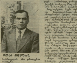
მთავარი მინისტრი, საქართველოს სსრ განაწილების მინისტრი.