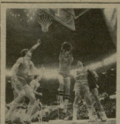
საბურთალოს საბავშვო სპორტული სკოლის ბავშვები