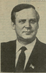
პრ. ნ. დ. გიგინიძის სსრ კავშირის მინისტრის სახელის ტაშაყვარიაძის რეპორტის შესახებ

სსრ კავშირის მინისტრის სახელის ტაშაყვარიაძის რეპორტის შესახებ