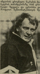
დღეს წინა მუშაობის გრძელვადიანი ნაკრების მუშაობის დასრულების შემდეგ თბილისის მსოფლიო ჩემპიონატისთვის მუშაობის დასრულების შემდეგ...