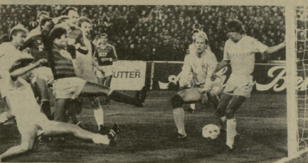
მსოფლიო ჩემპიონატი შესაბამისად ხდება სპორტის კონკრეტული წინადადება და სპორტის ფუნქციონირების განხორციელება — ი.0. ფილიპო დამსახურებით დასრულდა მსოფლიო ჩემპიონატი — 1. მარტი (პ. მარტი).

დღეს თბილისის 3. 0. ლენინის სახელობის „დინამოს“ სტადიონზე გაიმართება პარლამენტის ახსნა-შენიშნის მართვა-მართვის ხელშეწყობის სსრ კავშირისა და იმგლისის პროცესული ნაკრები ვაშლავა