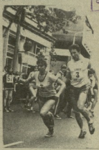
საქართველოს სსრის სპორტის განვითარების სახელმწიფო კომიტეტის მიერ... საქართველოს სსრის სპორტის განვითარების სახელმწიფო კომიტეტის მიერ...

Small vertical text on the right side of the page, possibly a date or page number.