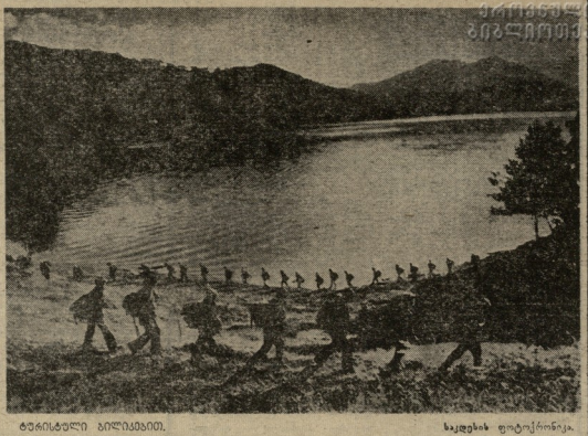
გვიგინული ბეწვდასი, საეკლავი ფოტოგრაფია.