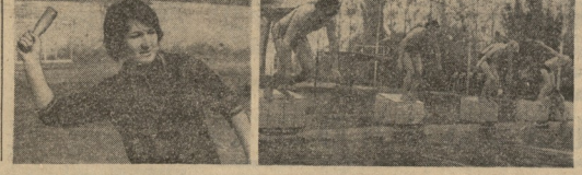
გენერალ-მაიორი, სსრკ-ის მსაჯულების ცენტრის მეთვლიყველი

საბჭოთა კავშირის ფიზკულტურისა და სპორტის ორგანიზაციის მიერ დატანილი 1984 წლის მსაჯულების შედეგების შესახებ