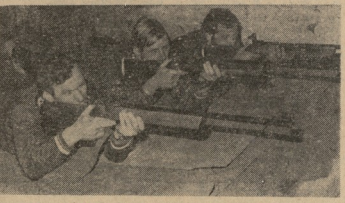
გენერალ-მაიორი, სსრკ-ის მსაჯულების ცენტრის მეთვლიყველი