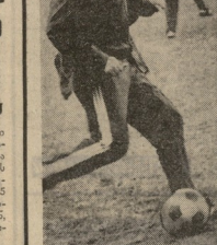
თბილისის „ლინაო“ პარკი