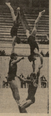
პირველსავე ბოლო ვაშლისა, ზაფხადილი!