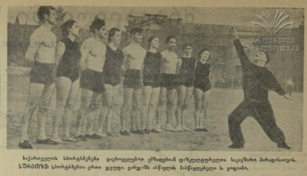
სპორტკლავის სპორტსმენები მსხვილმეტრე სპორტსმენებს დასწვრივს...