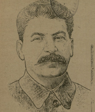
საბჭოთა კავშირის ხალხთა შრომის მეთაურთა...