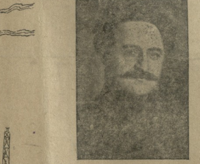
გაზეთის მთავარი რედაქტორი...