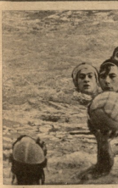
საქართველოში... მთელი საქართველო...