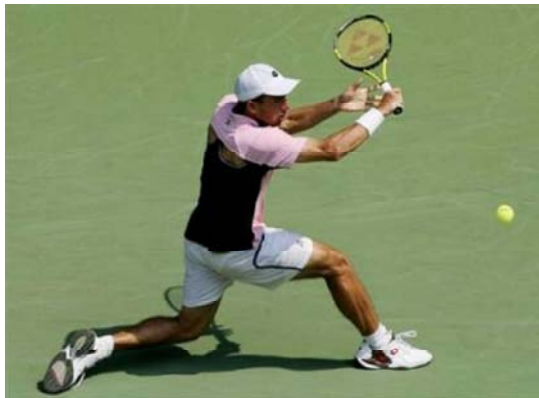
Открытый чемпионат Австралии (турнир из серии «Большого шлема»). Мельбурн, Австралия, 19 миллионов долларов