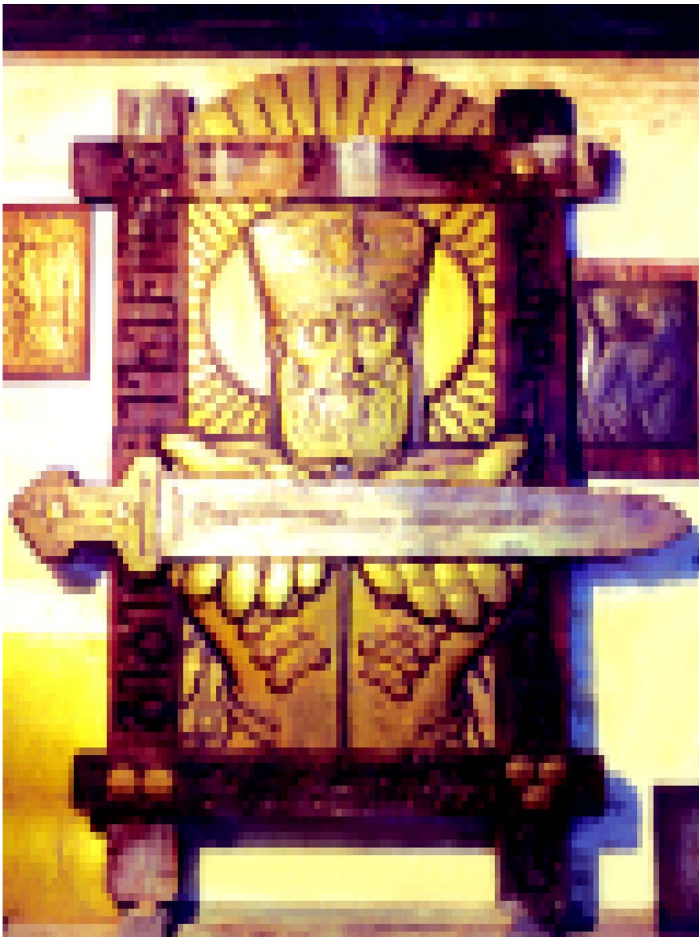
ЦАРЬ ИРАКЛИЙ II.