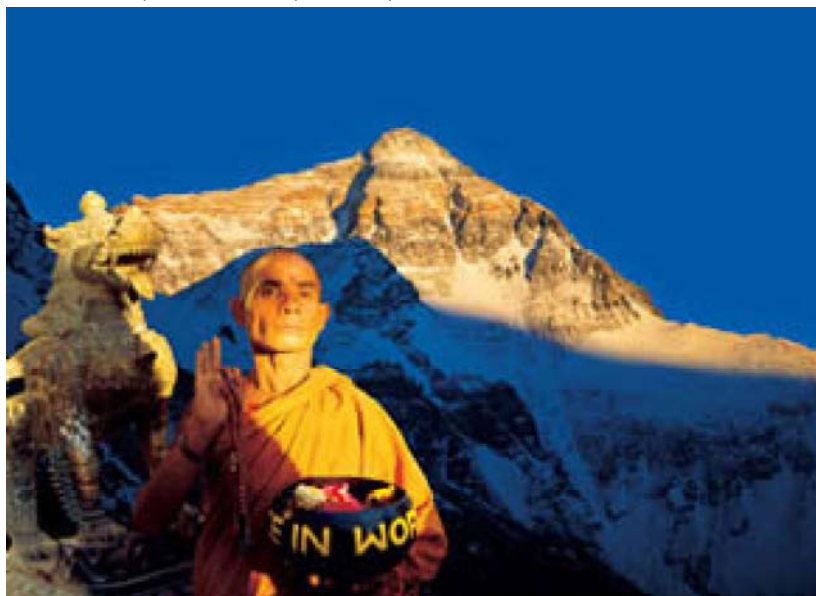
Вид на Эверест от монастыря Ронбук в Тибете. 1998 г. По прямой от фотографа до вершины горы — более 50 км!

Ввязавшись в такую проект и поставив на кон репутацию сразу двух собственных фирм, американцы обязательно найдут еще десяток международных корпораций, которые ухватятся за идею клещами! Это то, что Мельникофф называет перекрестным страхованием.