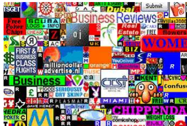
Скрин-шот с сайта Алекса Тью - milliondollarhomepage.com

Казалось бы, цель была достигнута - меньше чем через год после начала обменов Кайли, действительно, получил дом. Кстати, после того, как это случилось, человека, обменявшего дом на скрепку, начали просить