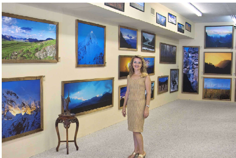
В одном из залов сети магазинов-галерей «MELNIKOFF Gallery Network» в городе миллионеров Бока-Ратон.

Не стоит здесь забывать и о роли красного вина в христианской религии. Консультанты компании считают, что это даст возможность вести крупномасштабную рекламу в СМИ с различной направленностью. Вплоть до религиозных газет и журналов. Которые, кстати, в иных случаях, ни при каких обстоятельствах не будут рекламировать алкогольные напитки. Нужна лишь конкретная торговая марка.