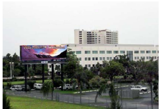
Дорожный биллборд во Флориде с рекламой MELNIKOFF Gallery Network.

мире должна быть огульной, как удар грома. Притягательной, как вода в пустыни, и убедительной, как библия. И еще она обязана быть чистой. Как цвета на флаге Грузии - красный и белый. Или, как старое, доброе вино.