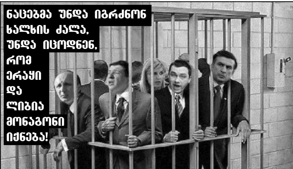
ნახევარ უნდა იბრძონ ხალხის კალა, უნდა იცოდნენ, რომ პრეზიდენტი და ლიბია მოსაზრებები იქნება!