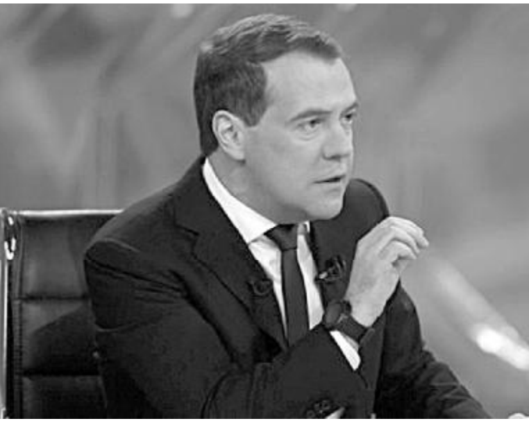
რუსეთის პრემიერ-მინისტრი საქართველოს ახალი მთავრობის, 2008 წლის ომის და საქართველოს პრაგმატიზმის შესახებ