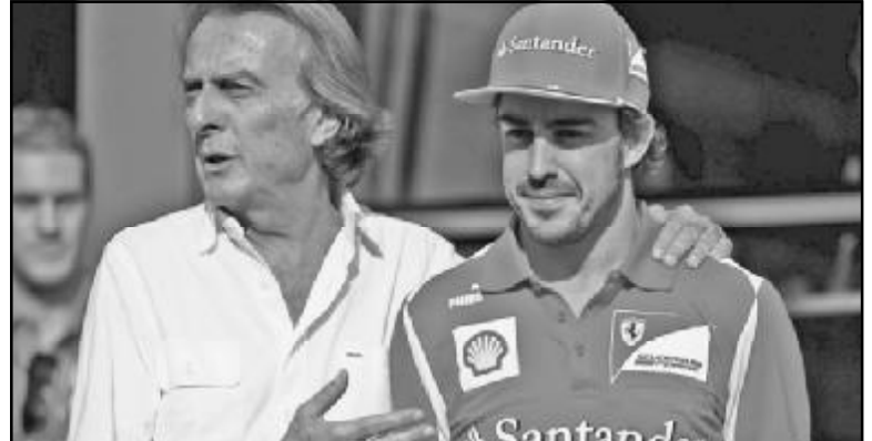
ორ რიგში დადგომა შექმნის. მან ჩვენთვის ძალიან ბევრი გაიღო და ვიცო, რომ სილვესტროს შემდეგ განსაკუთრებით უკმაყოფილოა. ეს ჩემთვის გასაკვირია, მაგრამ მე არ მომეწონა მისი დამოკიდებულება, სიტყვები. და მე ეს ალბენი შენი კიდეც. მე ყველას შევას...

სენე, მათ შორის პილოტებსაც, რომ ყველაფერზე წინ „ფერარი“ დგას, პრიორიტეტი გუნდია. ეს ოჯახივითაა, რომლის მამაც მის წევრებს ოჯახის პატივისცემისკენ მოუწოდებს და მე ოჯახურ ფასეულობათა კონცეფციას ვუსვამ ხაზს.