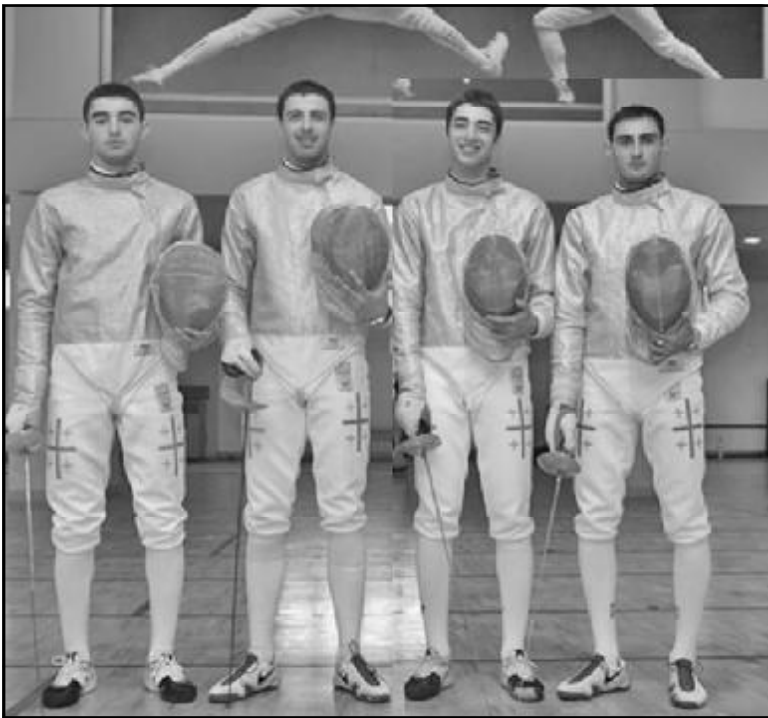
უნბრეთის დედაქალაქში მოფარეხიკავთა მსოფლიოს ჩემპიონატზე შეჯიბრებაში პირველები მოხალავენი ჩაებნენ. ქართველ მუშკე...