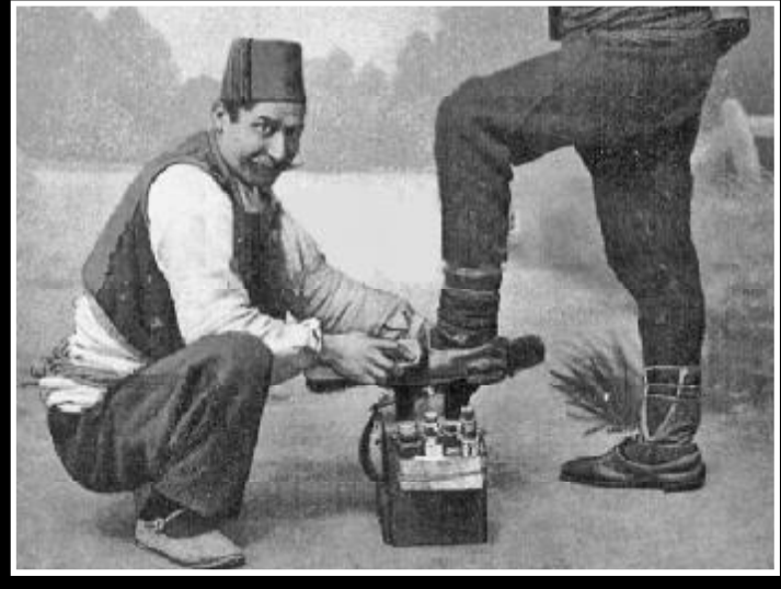
ფესსაცმლის განწმენდას ვუწოდებო? ორი-სამი წუთი, თუ ჩქემა არის ხუთი წუთი უნდა.

ჯაგრისით ფესსაცმელს უსვამენ, რამდენიმე წუთის შემდეგ ეგ მესამე ჯაგრისით წმენდენ და ბოლოს ზავერდის ნაჭრით აპირიალებენ.