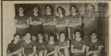
სპარტიო რევიზორების ფოტო...