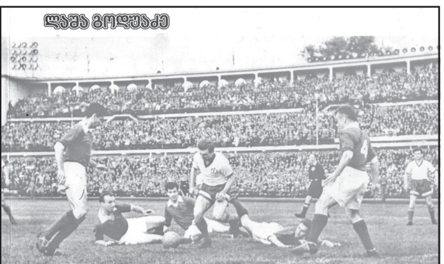
ბასკელები დაწყებული ისტორია თბილისის დინამოს საერთაშორისო მატჩები 1937-2017

21-ი საუკუნეში, როცა ინტერნეტმა წაღვეა საინფორმაციო სივრცე და წიგნი გერის როლში მოექცა, თითოეული კრებულის, რომ იტყვიან, ოქროდ ფასობს, მეტადრე იმ შემთხვევაში, თუ მას პროფესიონალი ავტორ-შემდგენლის კვალი ეტყობა.