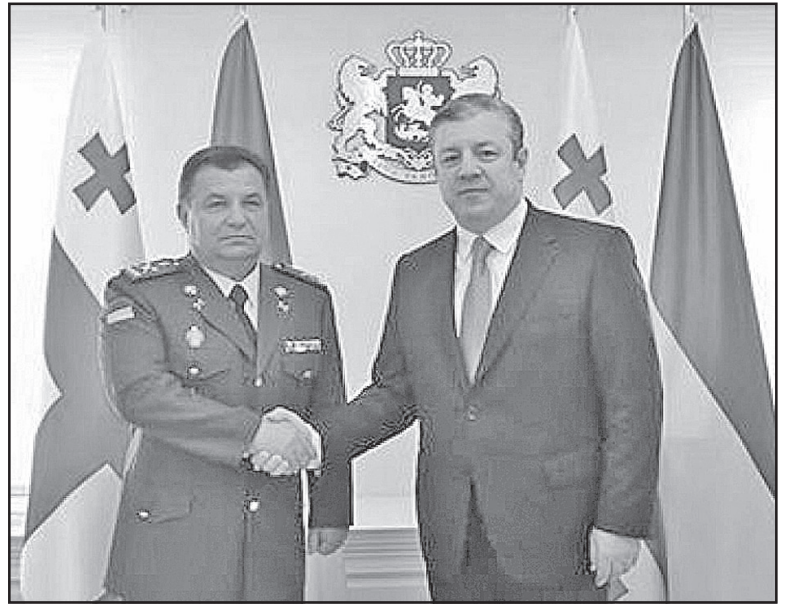
გაფართოებული შეხვედრის დასრულების შემდეგ, ორი ქვეყნის თავდაცვის მინისტრებმა განხილული თემები შეაჯამეს და ერთობლივი განცხადებები გააკეთეს.

იზორიამ ყურადღება ნატო-საქართველოს წვრთნისა და შეფასების ერთობლივი ცენტრის (JTEC) საქმიანობაზეც გაამახვილა და კოლეგას გამოცდილების გაზიარების მიზნით JTEC-ში უკრაინელი ექსპერტის მოვლინება შესთავაზა. უკრაინელი სამხედრო მოსამსახურეები კი, 2019 წელს JTEC-ში დაგეგმილ ნატო-საქართველოს სამეთაურო-საშტაბო სწავლებაში მონაწილეობის მისაღებად მიიწვიან. შეხვედრის დასასრულს კი, ლევან იზორიამ უკრაინელი კოლეგა საქართველოში, ოქტომბერში დაგეგმილ ყოველწლიურ „საქართველოს თავდაცვისა და უსაფრთხოების კონფერენციასა“ და სამხრეთ-აღმოსავლეთ ევროპის თავდაცვის მინისტრებთან ლევან