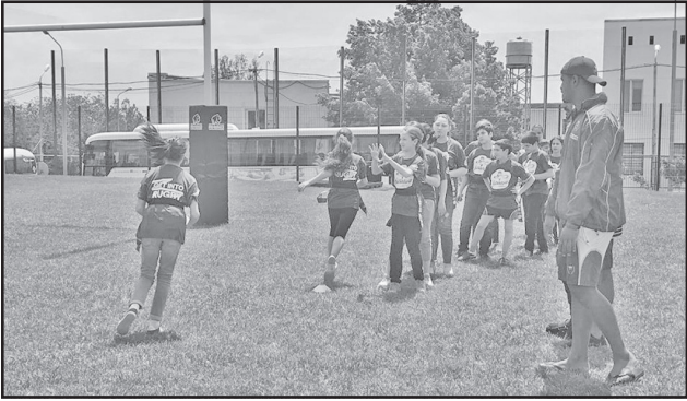
ღალი კლასის მასტერკლასები ჩაუტარეს. ამ მეგობრული შეხვედრით როგორც ბიჭები, ასევე გოგონებიც ძალიან გახარებულნი არიან.