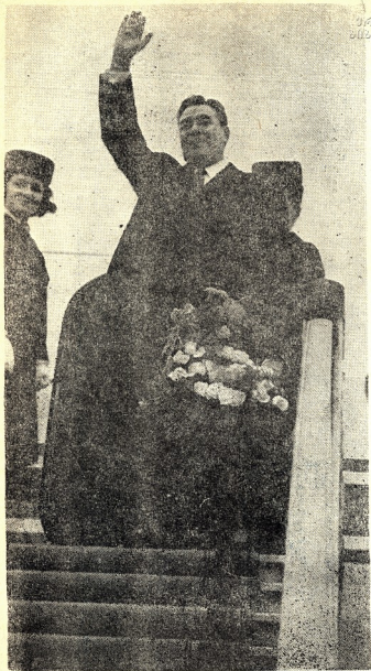
საკვ ტენტრალური კომიტეტის გენერალური მდივანი ლეონიდ ილიას-ძე ბრეჟნევი (სურათი გადაღებულია თბილისის აეროპორტში)