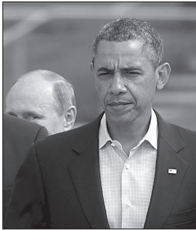
სათვის იყო განწინგებული.

შედეგად, რუსეთთან ვერც ერთ მნიშვნელოვან საკითხზე შეთანხმება ვერ მოხერხდა. მიუხედავად ამისა, პრეზიდენტი ობამა მოსკოვთან დიალოგის მაინც ჯიუტად ცდილობდა. ამან აშშ-ის კონსერვატიული ძალები აღაშფოთა. ჯონ მაკკეინი ობამას სულ უფრო ცხარედ აკრიტიკებდა. ამერიკული საზოგადოების ფართო ფენისათვის ცხადი გახდა, რომ „გადატვირთვა“ მხოლოდ ამერიკის პრეზიდენტს სურდა. შესაბამისად, ის მარცხი-