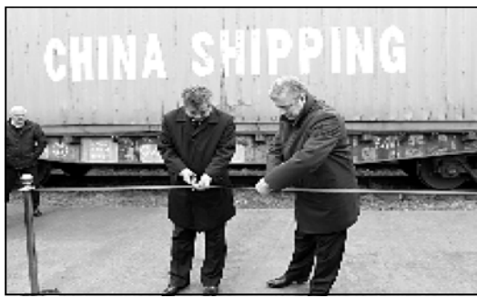
ინტერსებს უკვე ნაწილობრივ ჩინეთი დაიკავა, თან რუსეთთან დაბრუნების გზაზე.

— აბრეშუბის გზის გაკეთებით ჩინეთი რუსეთის კონკურენტი ხდება. რუსეთს აქვს ევროპული ამერიკის შუქმის ადგილი, რომ ეს ევროპისა და ჩინეთს შორის არსებული გზის გაკეთების ადგილია წინააღმდეგობა. აბრეშუბის გზის ადგილია ჩინეთს, რომ ამ საკომუნიკაციო მაგისტრალით მატერიალურად სავაჭროებს ჩინეთს, რათა ჩინეთი ევროპაში დომინანტი ქვეყანა გახდეს. ეს გააძლიერებს დაბრუნების რუსეთსა და ჩინეთს შორის. ამ პარალელურად საქართველოზე ამ გზის გაყვანა ნაშინაა, რომ გარდა ევროპისა, შუქმის