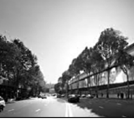
ბაღვალი თბილისი უნივერსიტეტი

თანამშრომლობის ფონდის ერთ-ერთმა მფარველმა ინვესტორმა, ეროვნული პრემია-მინისტრმა, ბიძინა ივანიშვილმა მთელი გადაწყვეტილება, სახელმწიფო პროგრამის „აწარმოე საქართველოში“ ფარგლებში ფონდის მიერ მიღებული ყველა შეღავათი საკუთარი სახსრებით დაფარავს.