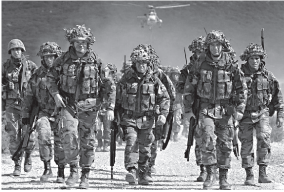
ევროკავშირი „აღმოსავლეთ პარტნიორობის“ ქვეყნების მიმართ პოლიტიკას ცვლის