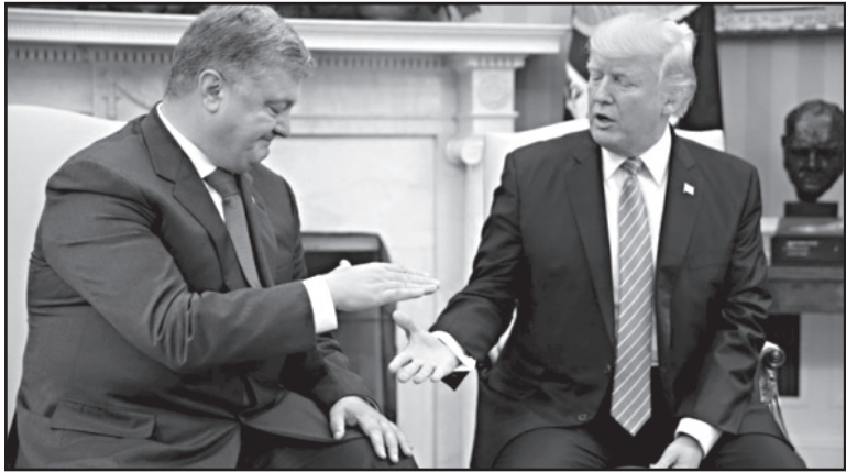
დონალ ტრამპს უკრაინის პრეზიდენტ ვოლოდიმერ ჯელენსკისთან შეხვედრა შედგა. ტრამპს ვიცე-პრეზიდენტი მაიკ პენსი და მრჩეველი მაკმასტერი დაესწრნენ.

ვაშინგტონში უკრაინისა და აშშ-ის პრეზიდენტების შეხვედრა შედგა. საუბარს ვიცე-პრეზიდენტი მაიკ პენსი და ტრამპის მრჩეველი ეროვნული უსაფრთხოების დარგში მაკმასტერი დაესწრნენ.