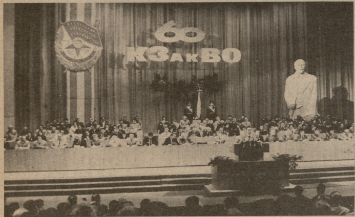
თბილისი. 1981 წლის 18 სექტემბერი. მხედრული ფონდლაროვნიკინი სამხარეო ოლქის მე-60 წლისამდე მინდვროს საზოგადოებას და სპორტის ფორმის (საქართველოს ფორმის).

აპირბასპასიონი ფონდლაროვნიკინი სამხარეო ოლქი 30-60 წლისამდე მინდვროს საზოგადოებას