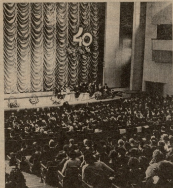
თბილისი ფუნდამენტის დიდი საკრებებიდან გამარჯვებით მათი 10 ზედაპირული მოდელი საბავთო ფენდში.