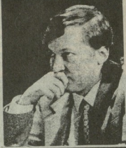
ანაკროპი ჰიუსის გარდა...