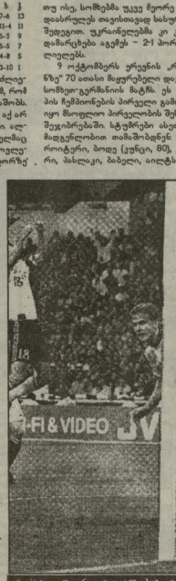
ბარსიონის (ცენტრი) ხახოვანი დაიკავეს ატალიის ზამრანი