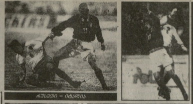
ԴԱՍԵՆ - ԴԱՏԱՐ