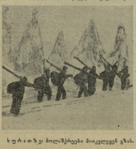
სურათი: მოლაშქრეები მიიკვლევენ გზას.