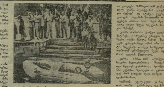
საპარკიორი, რომელიც იმყოფება...