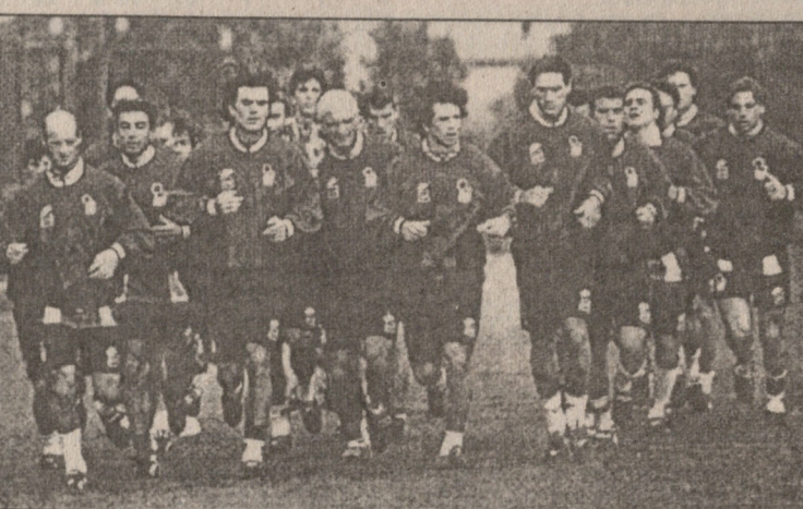
იტალიის ნაკრები მატჩის წინა შეკრებებს, მილანის მახლობლად, „ილვერმინოს“ ბაზაზე ატარებს ხოლმე. ამჯერად, რეზარე მალდინის შეგირდებმა ჩვეულებას უღალატეს და რუსეთთან შეხვედრისათვის რომის სამხრეთით, „ბორჯე-ზიანოს“ ცენტრში ივარჯიშეს. 27 ოქტომბერს, ნაშუადღევს „სკუადრა აძურამ“ ბოლო წრე შემოუარა სათამაშო მინდორს და მოსკოვისაკენ აიღო გეზი.

იტალიის საფეხბურთო ლიგის პრეზიდენტი ფრანკო კარათო: