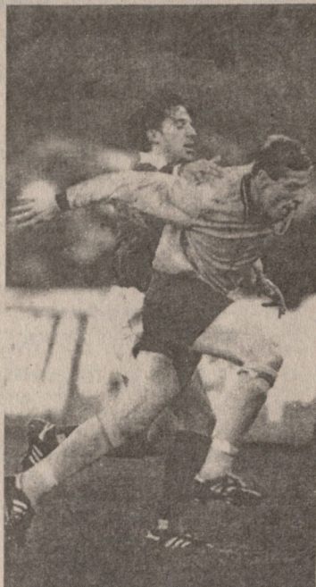
ოლეგ ლუენი (დია მისისურში) უკრაინელთა დაცვის იმედი

იტალია. თადაპირველად ჩეზარე მალდინიმ ნაკრებში გამოაძახებულ მოთამაშეებს შორის „იუვენტუსის“ მეკარე ანჯელო პერუჯინი დაასახელა, მაგრამ ბოლო მომენტში ექიმებმა მას ტრავმის გამო ვარჯიში აუკრძალეს, ისევე როგორც მცველ ჩირო ფერარას. მოსკოვში ვერ იაპარეზებს ნახევარმცველი ანჯელო დი ლივიო — იგი დისკვალიფიცირებულია. იტალიელები, რომ ჩეზარე მალდინის, პირველ ყოვლისა, დაცვის პრობლემა აწუხებს: ფერარას გარდა გუნდში ვერ ითამაშებს კრისტიან პანუჩი, სათუთა აგრეთვე მალო მალდინის გამოხვდაც. ნახევარდაცვა-