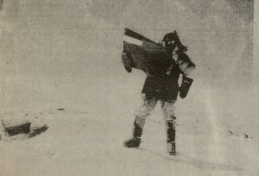
გინა თორსთაჲმ მხარეაჲთ სპორტის განვითარების მიზნით