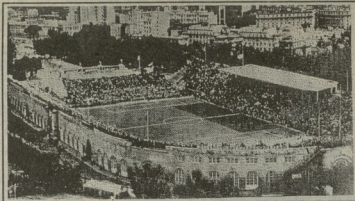
რომის სტადიონი 10 ივნისს ფინალურ მატჩს დღეს 80 ათასი მაყურებელი დიდი ინტერესით ადევნებს. იტალია იტალიის და ჩეხოსლოვაკიის ტექნიკის შრომას. რომლის ძირითადი ფრე დამთავრდა ფრედ — 1:1. იტალიელმა წარმატების სიღრმის დასაბუთებლად ორპირი გაიტანეს გოლი 17-ე წუთს გაიტანა სკაიფიმ.

ზამორა (ესპანეთი), მონცილიო (იტალია), კინტისი (ესპანეთი), მონტი (იტალია), ფორა IV (იტალია), სილვინი (ესპანეთი), გეიანი (იტალია), რეგერი (ესპანეთი), მეცა (იტალია), ნიუელი (ჩეხოსლოვაკია), ორინი (იტალია).