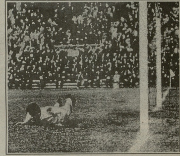
მატჩის ბოლოში გაიტანეს მატჩის ბოლოში გაიტანეს ორინი მე-80 წუთს ლანკისმა ვრადე მატჩის ბოლოში იტალიის ფორსოვანი „ვრადე“ დარტყმის.