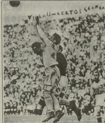
1934 წ. ფინალი. იტალია-ჩეხოსლოვაკია. შვეიცარ ლანკისმა მუდმივად ერთმანეთს შრომის ფრედ.