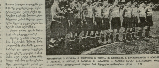
სპორტის მოწოდების განხორციელება...