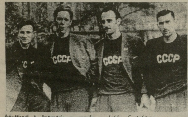
მარტინი & ლეგენა, ა. კლინი, ი. კარბი, & რიკოვი

1949. პარიზი-ბილინი (პარიზი). 21.04-7.05. 1. ურუგვაი, 2. ბრაზილია, 3. ჩილე.