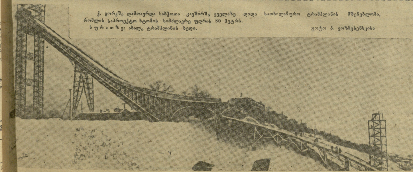
ქ. გორკის დამთავრდა საბჭოთა კავშირში ყველაზე დიდი სათხილამურო ტრამპლინის მშენებლობა, რომლის სპაროქტო ბტომის სიმძლავრე უდრის 80 მეტრს. ს უ რ ა თ ე: ახალი ტრამპლინის ხედი.

მსაჯთა კოლეგიაში სახეიმოდ კრების მაგიდასთან მიიწვია ტურნირის მონაწილენი კენკის საყრდელ მონაწილენი ამ ცერემონიის შემდეგ სატურნირო ცხრილში ასე განაწილდნენ: 1. ოსტატი ბ. გურგენიძე, (თბილისი), 2. გროსმაისტერი ტ. პეტროსიანი (მოსკოვი), 3. ოსტატი ა. ბანიკი (კიევი), 4. გროსმაისტერი ვ. კორჩნოი (ლენინგრადი), 5. გროსმაისტერი ა. კოტოვი (მოსკოვი), 6. გროსმაისტერი მ. ტალი (რიგა), 7. გროსმაისტერი მ. ტაიმაზოვი (ლენინგრადი), 8. ოსტატი ლ. პოლუგაევსკი (კუბიშევი), 9. გროსმაისტერი ე. გელერი (ოდესა), 10. ოსტატი გ. ბორიანკო (სვერდლოვსკი), 11. საერთაშორისო ოსტატი ს. ფურმანი (ლენინგრადი), 12. ოსტატი ვ. კროვიუსი (ნოვოსიბირსკი), 13. ოსტატი ა. ვიკსლისი (რიგა), 14. გროსმაისტერი ბ. სპასკი (ლენინგრადი), 15. გროსმაისტერი ა. ტოლუში (ლენინგრადი), 16. გროსმაისტერი დ. ბრონშტეინი (მოსკოვი), 17. გროსმაისტერი ი. ბოლესლავსკი (მინსკი), 18. გროსმაისტერი ი. ავერბახი (მოსკოვი), 19. ოსტატი ა. სუტეინი (კიევი).