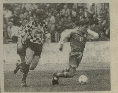
„ვიტას“ და „ბეკლესეოსტო“ თბილისის სპორტის სასახლეში. კოტორსკის ვიდეო

მადრიდის მუხტელები იტალიურ კლბებს წინა შეხვედრაში დაამარჯვებინეს. მატჩი დასრულდა 1:0-ით. „აქონის“ მატჩი დასრულდა 1:0-ით.