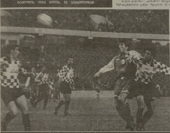
„დიპლომატი“ — „აქონის“ მატჩის ფრაგმენტი. კოტორსკის ვიდეო

მადრიდის მუხტელები იტალიურ კლბებს წინა შეხვედრაში დაამარჯვებინეს. მატჩი დასრულდა 1:0-ით. „აქონის“ მატჩი დასრულდა 1:0-ით. „აქონის“ მატჩი დასრულდა 1:0-ით.