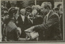
აქტიური კორპორაციის ფორმის... აქტიური კორპორაციის ფორმის...