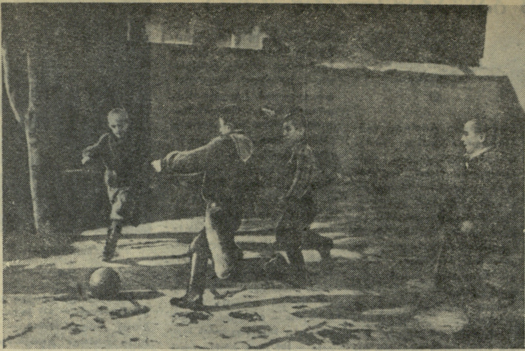
არაოფიციალური მატჩები დაიწყო.