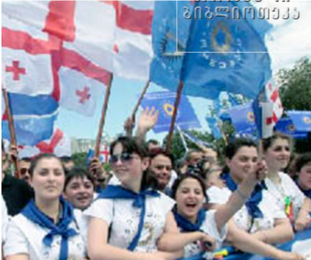
თბილისი. 27 მაისი 2012 წელი. „ქართული ოცნების“ აქცია.