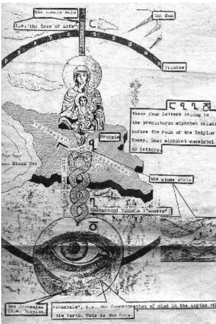
გივი ალაზნისპირელის წარმოსახვითი ნახატი