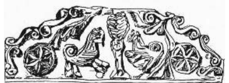
ლაზური სიციციელის ხე - ვინჯარო