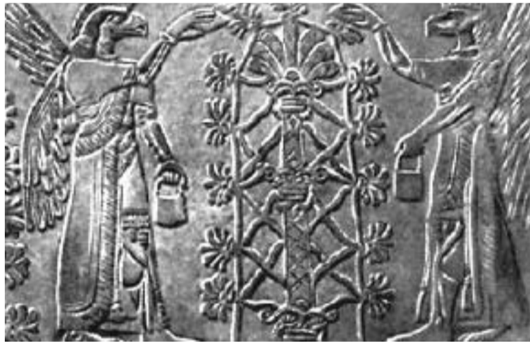
შუამერული ფილა სივლიოზასის ხით და ორი ჩასასვლელი

გივი ალაზნისპირელი: — „1) დედამიწის 42 გრ პარალელისა (რო-