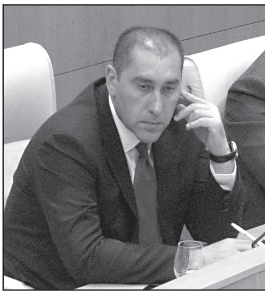
გლებში რა მთავარი გზავნილები, დავალება მიიღეთ ხელისუფლების უმაღლესი პირებისგან?

– ოკუპაცია არის ყველაზე მტკივნეული პრობლემა საქართველოსთვის. კონკრეტული გადაწყვეტილება არის მიღებული აშშ-ის მიერ, ეს არ არის მხოლოდ პროტესტი მათი მხრიდან. კონკრეტული გადაწყვეტილება კი არის ის, რომ ამერიკა აღარ დაეხმარება იმ ქვეყნებს, რომლებიც აფხაზეთსა და ოსეთს აღიარებენ. ეს მარ-