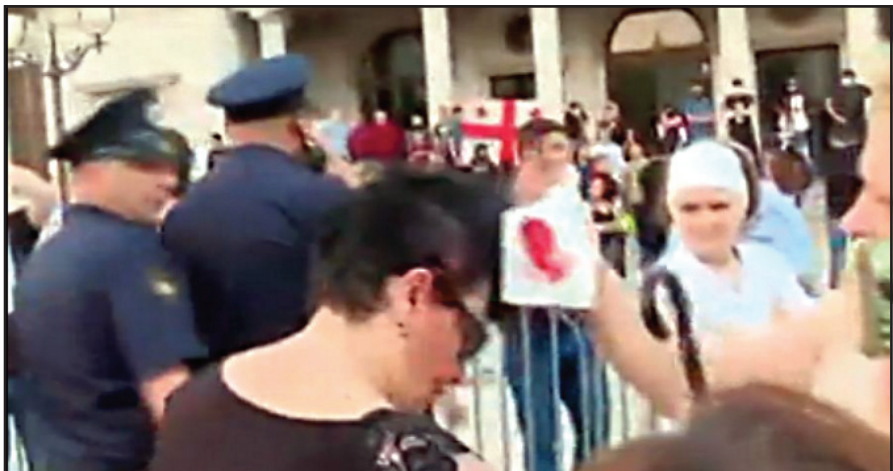
აქციაზე დაპირისპირებისას 1 ქალი დაშავდა