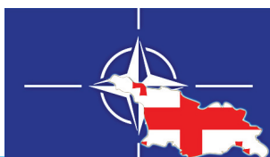
რა რისკებს ელიან რუსეთიდან უახლოეს მომავალში