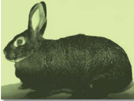
ახალი ქართული სახორცე-საქურქე ჯიშური ჯგუფის ბოცვერი

ლებული ფორმისაა და სხეულის უკანა მესამედი უფრო ძლიერად არის განვითარებული. ამასთან, დედა ბოცვერების ცოცხალი მასა, მამლებთან შედარებით, რამდენადმე მეტია.