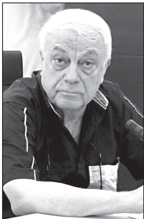
ამერიკამ რიჩარდ ნორლანდი პარტკომად დაგვინიშნა

მათზე კარგს არასდროს ვიტყვი. ესენი შეგებულად გამოუშვეს ქუჩაში. ეს ლგბტ არის ერის