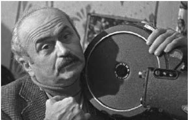
(გაბრძემბა, დასაწყისი ნს. „სბ“ N1-12 2017)

რეზოს ნერვიული შეხვედრები ჰქონდა ხელმძღვანელობასთან. მათ თურმე ფილმის წარმოების დასურვა უკვე გადაწყვეტილი ქონდათ. რეზომ სერიოზული დიპლომატიური მანევრები დაიწყო და მოლაპარაკებები მრავალჯერ დაიწყო მძიმე პოზიციურ ბრძოლაში გადაზარდა. დირექციას დათმობა არაფრით უნდოდა, თურმე ბრძანება გამზადებული ყოფილა ფილმის დახურვის დაახლოებით ისეთივე მოტივით, როგორც ჩვეოდათ —, გადაღებული მასალის უპერსპექტივობის გამო” და ა.შ., მაგრამ რეზომ თავისი (ჩვენი) მაინც გაიტანა და „ლაზარეს“ გადაღების გაგრძელების უფლება როგორც იქნა მიიღო...