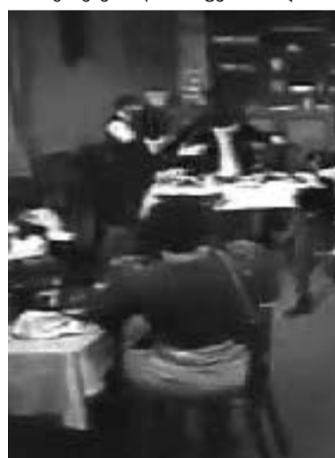
ძალიან გვებნარებოდა შემდგომშიც, ფილმის გადაღებების დროს.