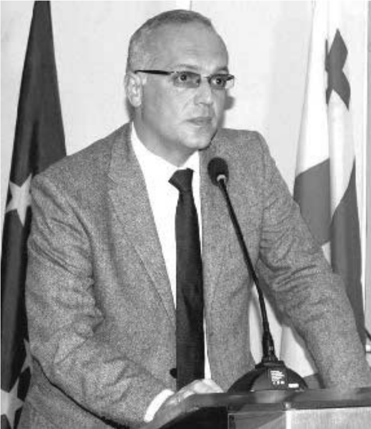
გვესაუბრება ქალაქ ზუგდიდის მერი, ბატონო ირაკლი ბოგოშია.

ბატონო ირაკლი, როგორ შეაფასებთ ბოლო სამი წლის მუშაობის შედეგებს, რა გაკეთდა ამ დროის მანძილზე ქალაქ ზუგდიდში?