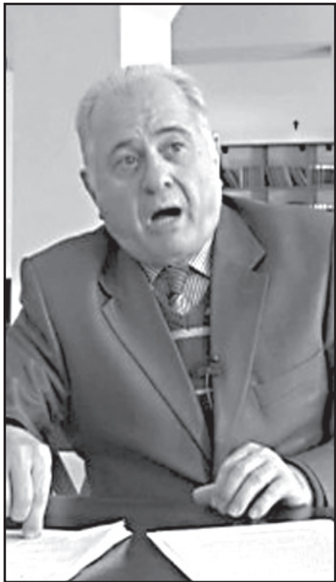
ლოვედებიან, აფხაზეთის ანექსია შეუძლებელი იქნება.