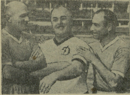
ფეხბურთის ვეტერანთა შეხვედრაში ამ ბოლო ხანებში კარგ ტრადიციად იქცა.