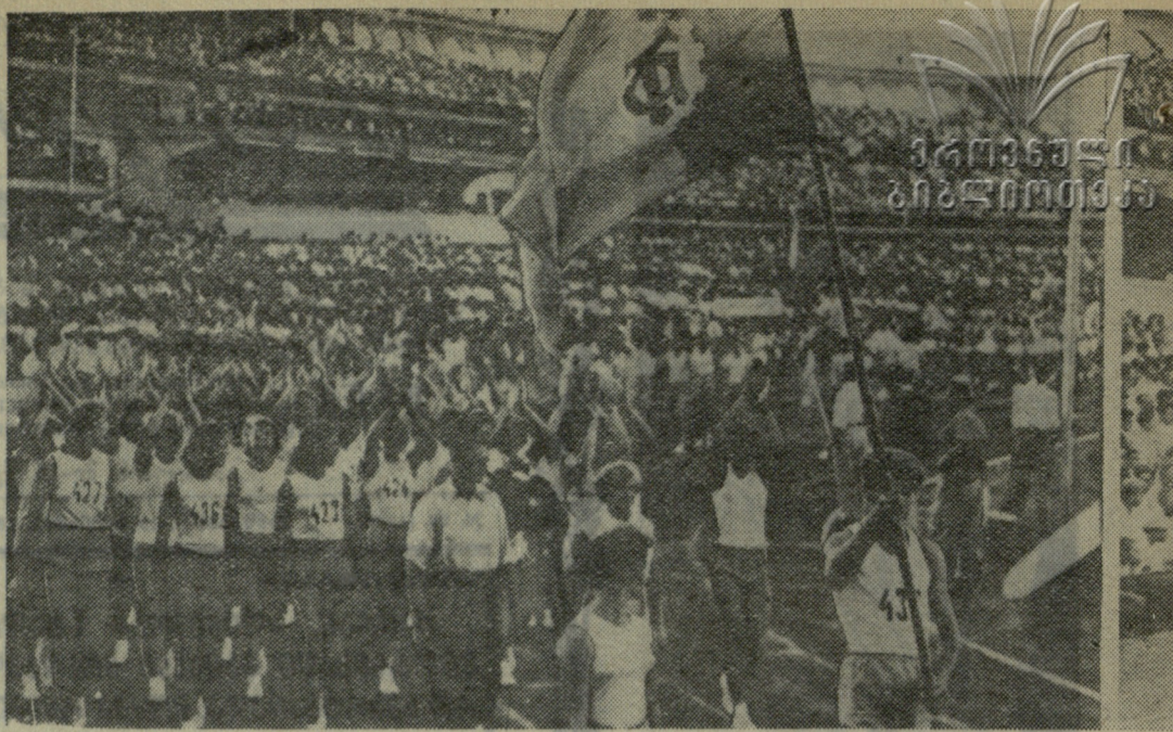
მოსწავლეთა V საკავშირო სპორტკლასის გახსნისადმი

გ ო გ ო ნ ე ბ ი. პირველი დღე — მოსკოვი-ლატვია — 3:1, ლიტვა-ესტონეთი — 3:2, „შრ. რეზერვები“ — ლენინგრადი — 3:1, მეორე დღე — ესტონეთი-ლენინგრადი — 3:2, მოსკოვი-„შრ. რეზერვები“ — 3:0 და უკრაინა-ლატვია — 3:1.