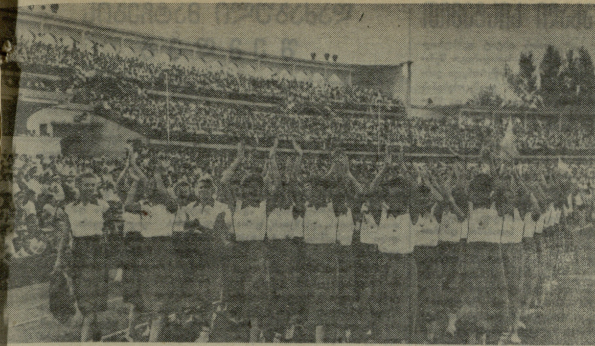
დღილი საზეიმო მარშის მონაწილენი „დინამოს“ სტადიონზე.