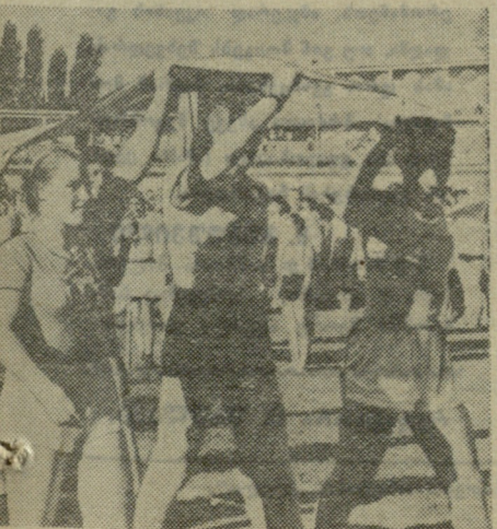
ვთ ნორჩ სპორტსმენებს.

დამთავრდა ფეხბურთელთა შეხვედრები ქვეჯგუფებში, მაგრამ ნამდვილი ბრძოლა პირველობისათვის იწყება ახლა, როცა შედგა ორი ფი-